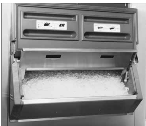
Volet régulateur de glaçons exclusif SmartGATE

Chariots supplémentaires et accessoires (se reporter à la fiche N° 3435)