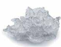
AF 127 Glace en grains Eau résiduelle 25%