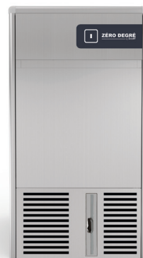
GPC 23 Nano AS/WS