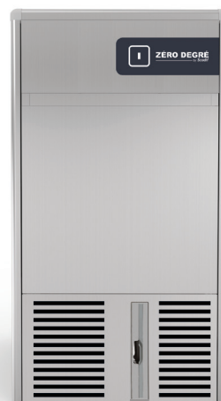
GPC 23 Nano AS/WS

La nouvelle gamme de machines à glaçons creux GPC est conçue d'après les derniers standards européens et produit des glaçons grâce à un système à palettes.