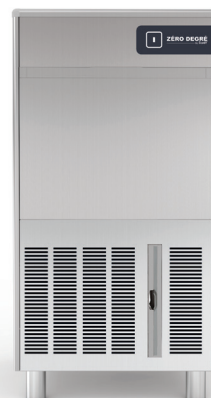
GPC 50 AS/WS