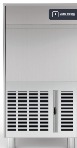
GPC 50 AS/WS

La nouvelle gamme de machines à glaçons creux GPC est conçue d'après les derniers standards européens et produit des glaçons grâce à un système à palettes.