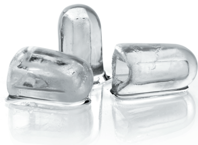
Glaçons « Creux de 21gr »

Autres modèles de cette gamme de machine à glaçons « creux » : GPC 23 Nano, GPC 23, GPC 25, GPC 30, GPC 36, GPC 45, GPC 62, GPC 80, GPC 95, GPC 150