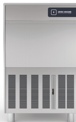
GPC 62 AS/WS

Autres modèles de cette gamme de machine à glaçons « creux » : GPC 23 Nano, GPC 23, GPC 25, GPC 30, GPC 36, GPC 45, GPC 50, GPC 80, GPC 95, GPC 150