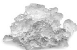
MXF 427 Glace en Supergrains Eau résiduelle 12%